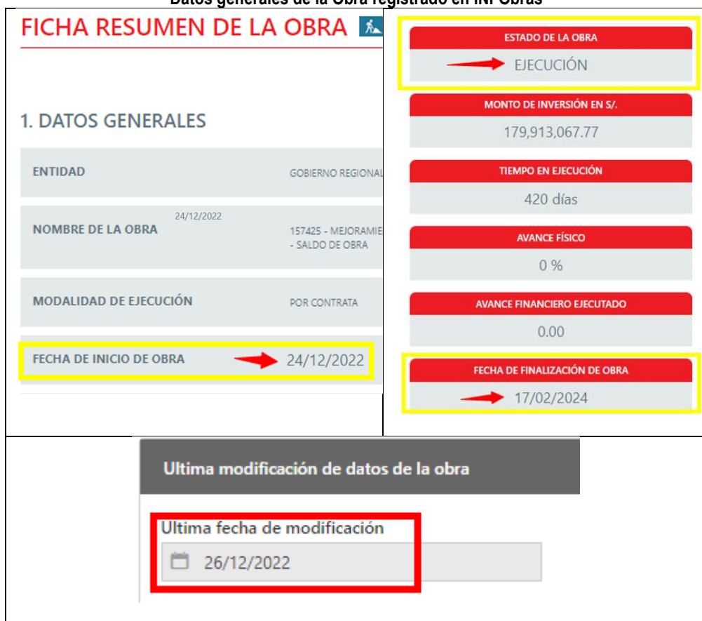
Gráfico n.º 1 Datos generales de la Obra registrado en INFObras

Fuente: Sistema de Información de Obras Publicas – INFOBRAS, consultado el 28 de diciembre de 2022, en relación al proyecto registrado con código INFOBRAS n.º 157425.