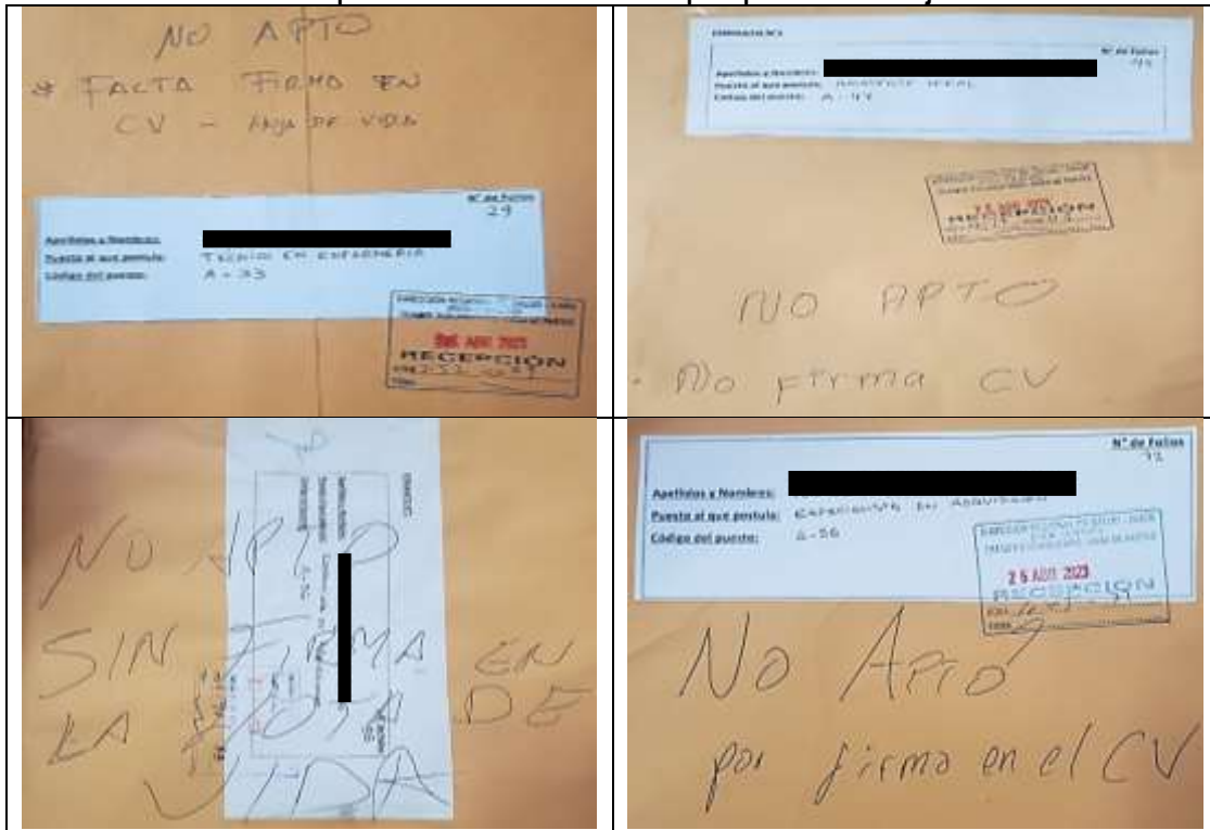
Imagen N° 13 Sobres de postulantes considerados no aptos por no firmar hoja de vida