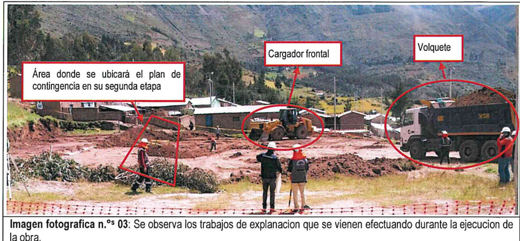
Imagen fotografica n.ºs 03: Se observa los trabajos de explanación que se vienen efectuando durante la ejecución de la obra.