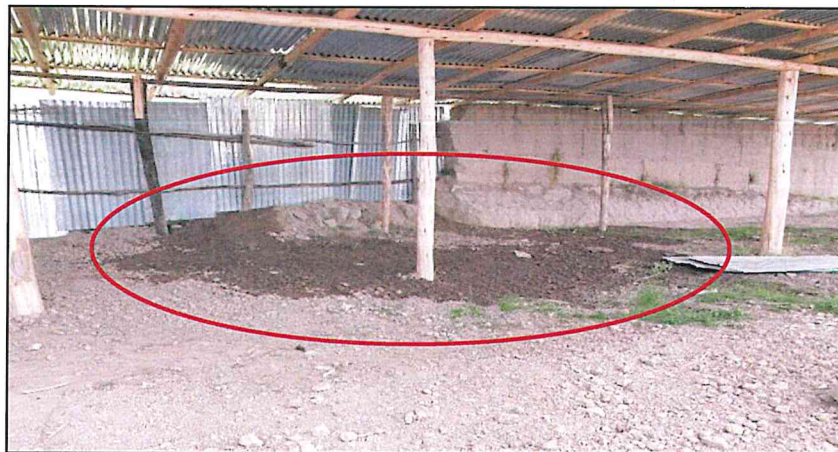
Imagen fotográfica n.º 8 Presencia de humedad en el almacén de la Obra