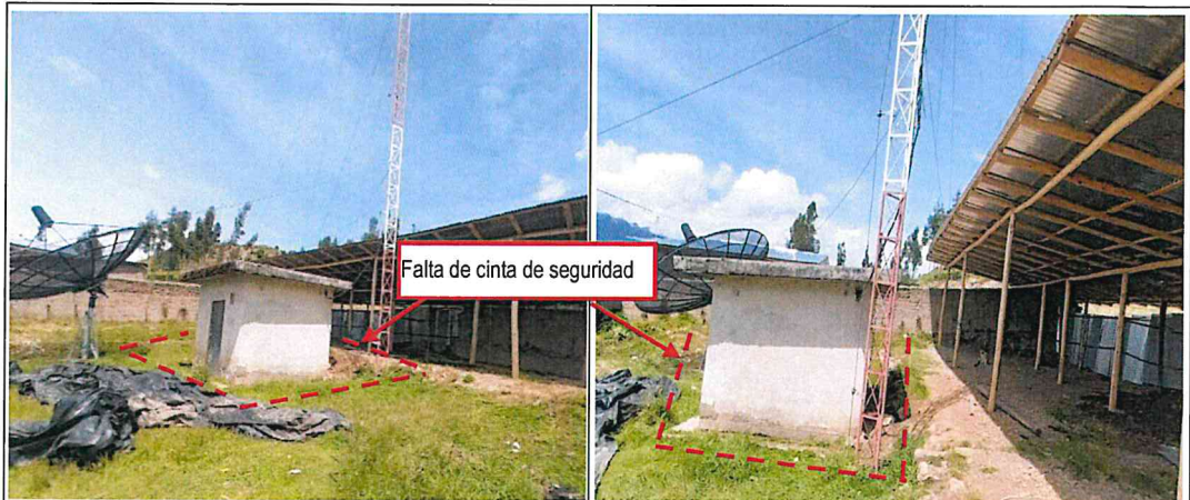
Imagen fotografica n.º 06 y 07: No se advierte señalizaciones de seguridad. Asimismo, se aprecia la presencia de una torre y antena de telecomunicaciones, así como, una estructura de concreto cerca al almacen de la obra.