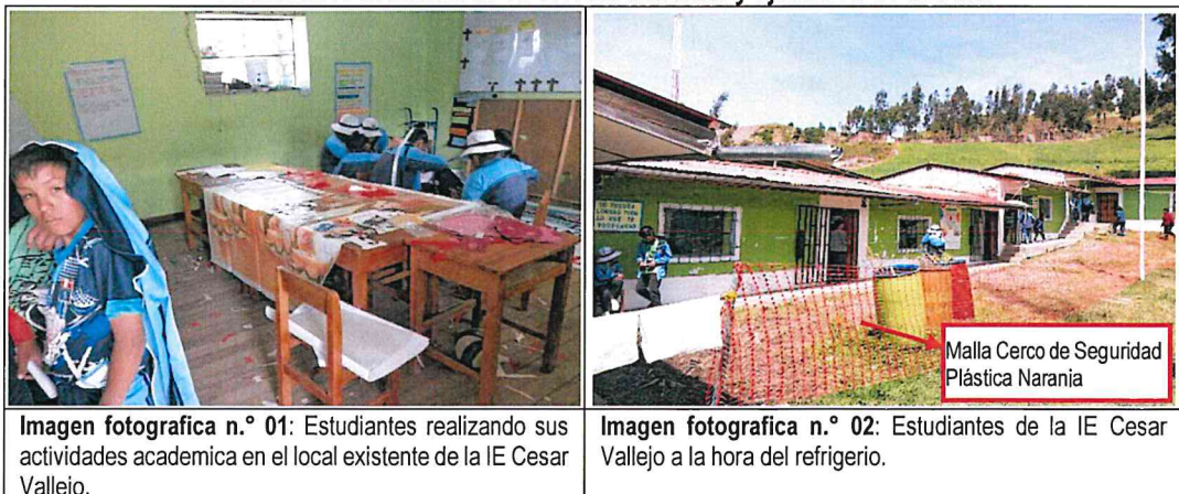
Imagen fotografica n.º 01: Estudiantes realizando sus actividades académicas en el local existente de la IE Cesar Vallejo.