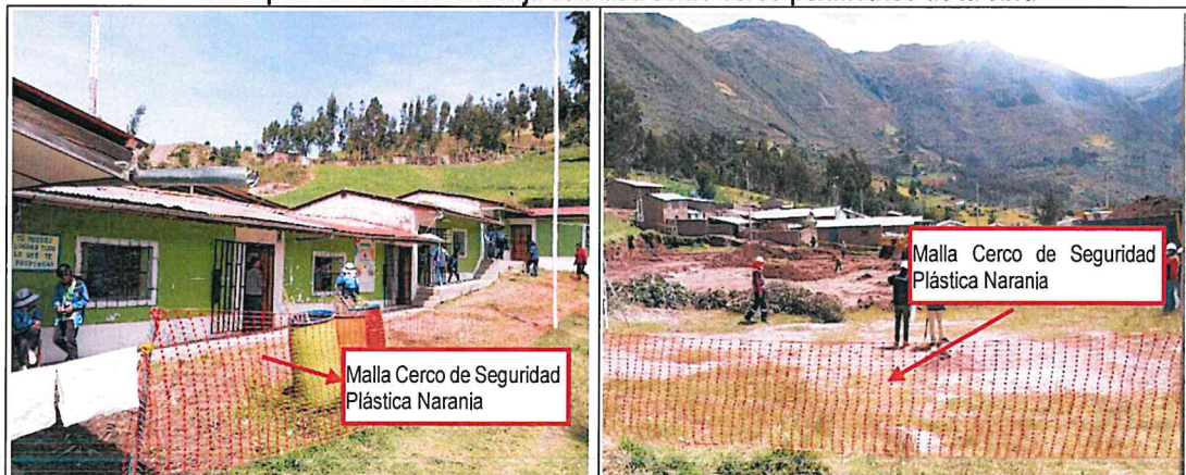
Imagen fotografica n.ºs 04 y 05: Se observa una malla plástica de color naranja utilizada como cerco perimétrico de la obra.