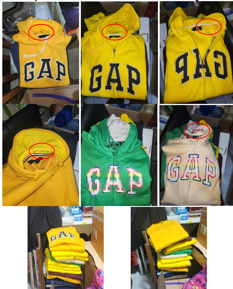
Panel de Fotográfico n.ºs 2 Poleras y buzos hallados en almacén del CAR San Vicente el 2 de agosto de 2024